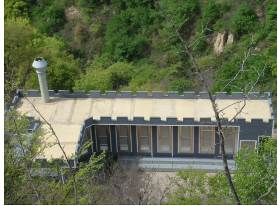
万里の長城（世界遺産）CHINESE WALL (WORLD HERITAGE) 建屋