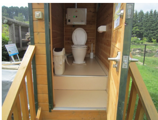
ドッグラン駐車場横