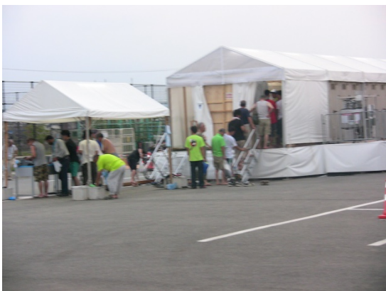
大会会場設営風景