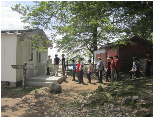
5月山開き使用風景