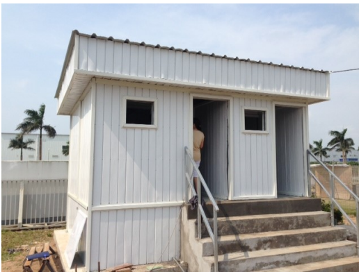
工業団地建設現場 CONSTRUCTION SITE