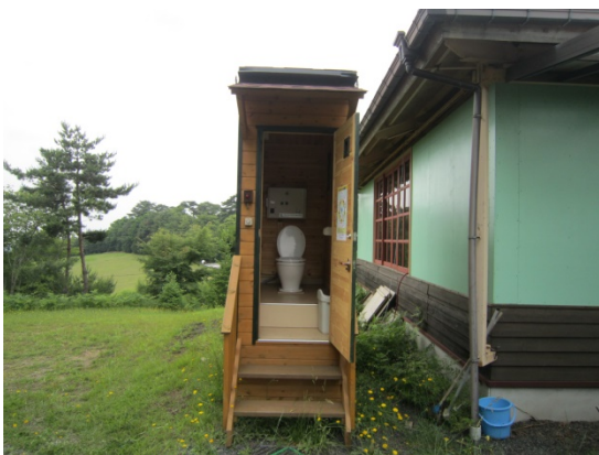
バーベキューレストラン横